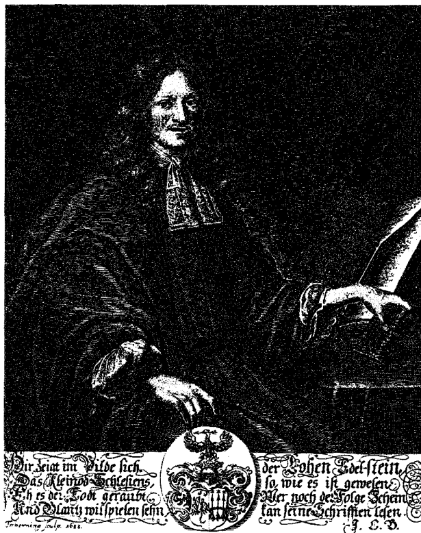
Dichter-Gelehrter Lohenstein (Kupferstich von 1688), Titelblatt einer Gryphius-Werksammlung

Squentz“) machten den Juristen aus Glogau bekannt. Aber er dichtete auch Sonette über die Vergänglichkeit: